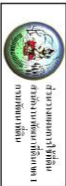
รูปที่ 3-3 แผนที่ภาพถ่ายดาวเทียม พื้นที่ตำบลบ้านโพน อำเภอเมือง จังหวัดนครราชสีมา